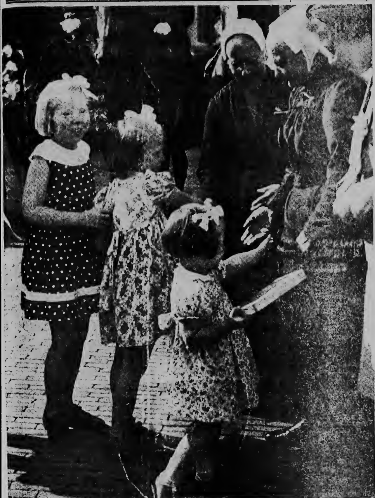
Na 1947 na palacio Soestdijk. Di tur parti di Hulanda hendenan a bini n'e Palacio pa felicita Margriet coe motibo di su cumpleaños. Tambe e „boerenvrouwjes” den nan traje especial a trece algo dushi pa e hacdo di anja. Henteramente patras nos por welta prinses Beatrix, y su dilanti su roeman muheruan Irene y Margriet.